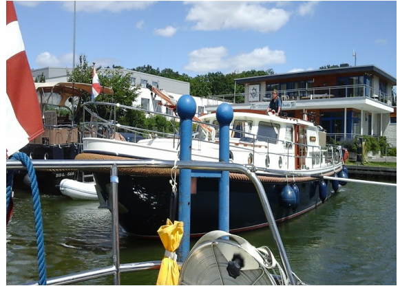
Wolfsburg med stor hollænder som blev smidt væk, da han blokerede for vand og diesel.

Turen som normalt sagtens kan gøres på 3-4 uger tog så 8 og blev meget længere, men heldigvis havde vi mulighed for bare at forlænge, og vi fik jo set noget helt andet end vi havde regnet med, og det er jo i grunden ikke så dumt. Er der nogen der vil have yderligere fiduser til denne tur, så bare kontakt os.