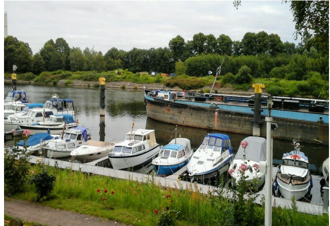
Lauenborg med en gammel pram som ydermole

Da vi kommer ned vælger vi at sejle lidt modstrøms på Elben til Lauenburg (herude vest på Elben kan selv store skibe altid gå ind). Vi valgte at ligge i en lille motorbådsklub og ikke den store kommunale marina, hvilket tyske sejlervenner anbefalede, og de havde ret, da vi oplevede den kvindelige Havnefoged i fuld aktion da vi skulle tanke diesel og hun hele tiden havde en Caffé Latte i munden igennem sugerør..., mens hun råbte og skreg. På serbo-kroatisk/tysk lydende sprog..., men vi fik tanket dagen efter..