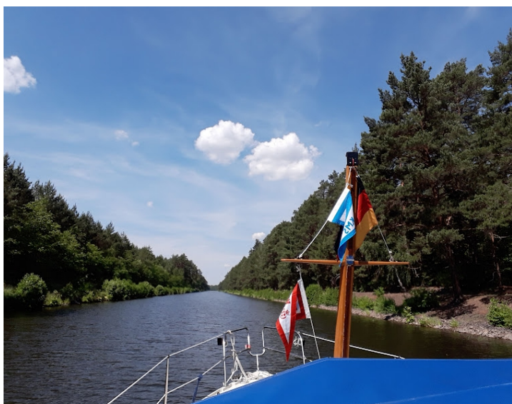
Vidunder grøn kanl med masser af fugleliv eks. hejrer og storke.

Vejret er stadig meget varmt og at ligge midt i en storby med store grønne træer og stilhed er en ting alle burde unde sig selv. Vi skal jo videre, men den fine nye sluse er i stykker, så vi må en omvej på 3 timer igennem Berlin for at ende 500 meter fra vores havn... Det er de små overraskelser man må være belavet på. Fra Berlin ville vi gerne have været et smut oppe i de skønne søområder nordpå og så hjem via Elben..