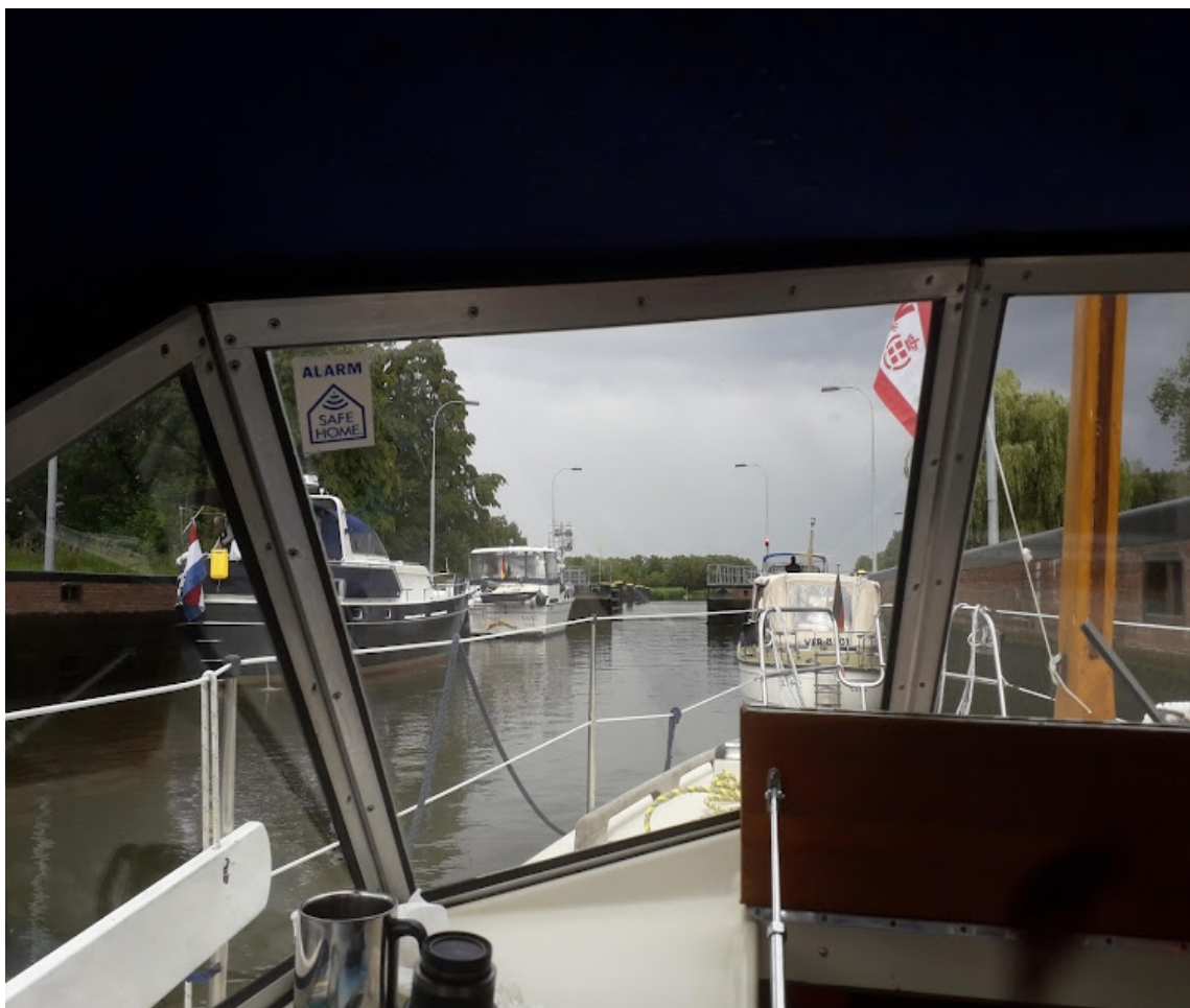
Så er det ved at være slut med kanal sejlads, vi er lige uden for Lübecks store, trafikerede havn

Turen nordpå mod Lübeck er romantisk og køn, og meget uproblematisk, og udsejling igennem Lübeck er et direkte hit. Havde vi vidst bedre havde vi nok lavet vores kanaltur spejlvendt, da det østligste Tyskland og Polen passer os vidunderligt som afslapning til sidst. Så skal man sejle sine første kanaltur, så er det oplagt at sejle Elbe-Lübeck kanal op til Lauenburg. Der er ikke så mange sluser og der er tid til at få rutine, da der ikke er meget erhvervstrafik. Alt fungerer fint i Tyskland, man skal bare have sin båd klar til kanalfart, og det har enhver sejler sørget for, efter at have sat sig ind i sagerne. Vi ville gerne have været afsted igen, men Miss Corona gjorde det svært i 2020/21, så det blev det ikke lige til.