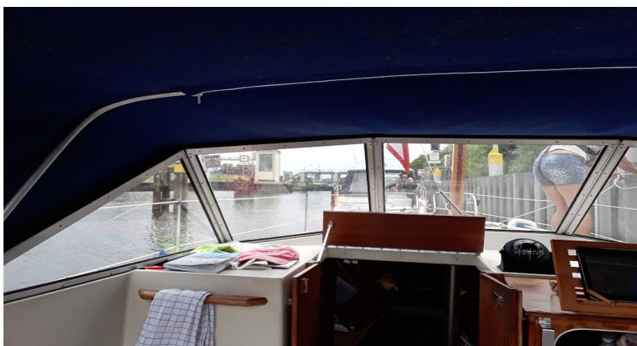
Niederfinow, det imponerende Hebewerk som blev færdiggjort i 1934 og stadig bruges.

Vi ville jo til Berlin, og havde købt Kanalkort fra Kartenwerft og de var glimrende, men ikke uundværlige, da vores Navionics virkede perfekt. En tysker vi mødte, fortalte at han benyttede Google maps, og i princippet har han jo ret i at det fungerer fint også. Vi kan godt lide at planlægge næste dags tur, så jeg elsker papirkort til planlægning.