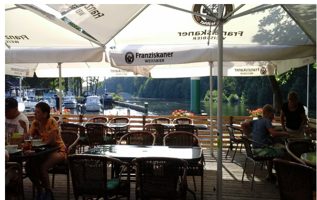
Aftenstemning ved Oderberg