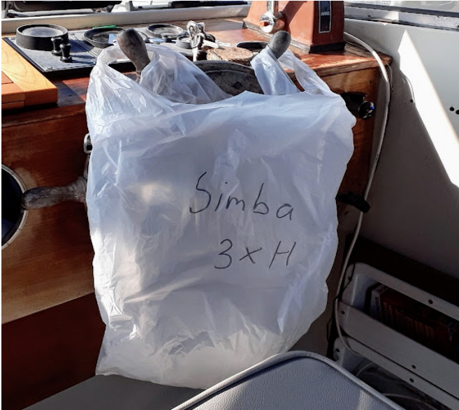
Selvom man lå midt i en skov, var der en venlig mand som hentede morgenbrød på sin gamle østtyske knallert

Skidt pyt, vejret er godt (næsten 40 C), og så er her kønt og 15 min. gang til indkøb og køleskabet kører fint. Vi kører med et 220V køleskab med lille fryser og det kører fint med en inverter, nu man sejler for motor hele tiden. Hvad der ikke virker så godt er vores Ipad som ikke kan lide varmen, men det klarer vi ved at skifte mellem Fruens og min Tablet. Når den ene bliver varm kommer den i køleskab og den anden bliver brugt..., og det virker fint. Læg mærke til 2 forskellige styresystemer er lig med dobbelt sikkerhed (erhvervsskade fra min tid i avisbranchen med dobbelt sikkerhed på alt udstyr).