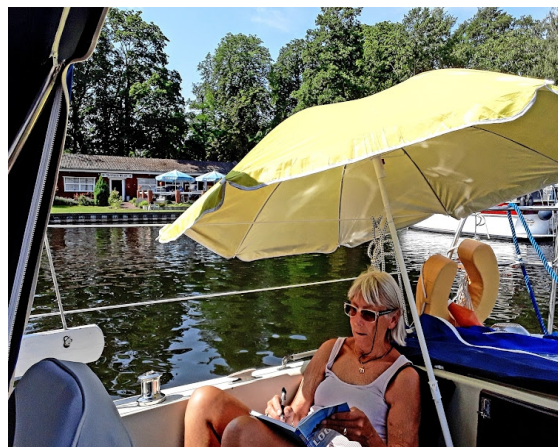
Målet er nået, vi er i Spandau midt i millionbyen

Det blev det ikke til, da endnu en sluse var ude af drift og vandstanden på Elben kun var på 60 cm., og det er for lidt til os. Vi valgte at sejle sydpå til Magdeburg (Mittelandskanal) og via Aquadukt over motorvejen til Elbe Seiten kanal og dernæst via Lübeck hjem.