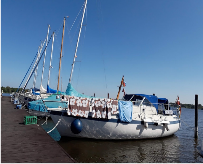
Det ligner en Zigøjnerbåd, men der skal vaskes og gøres rent.